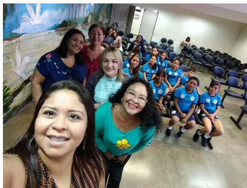
Crianças e Adolescentes Apresentando Propostas