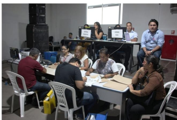
Comissão Eleitoral na Apuração