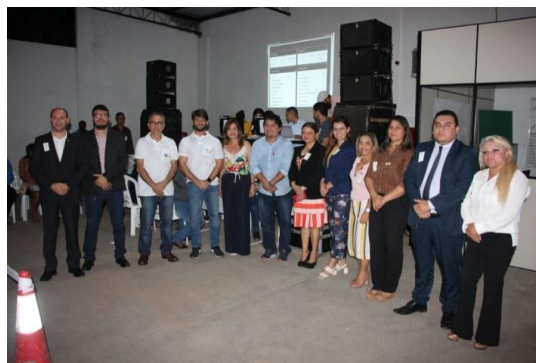
Comissão Eleitoral, MP e Equipe SEMAST