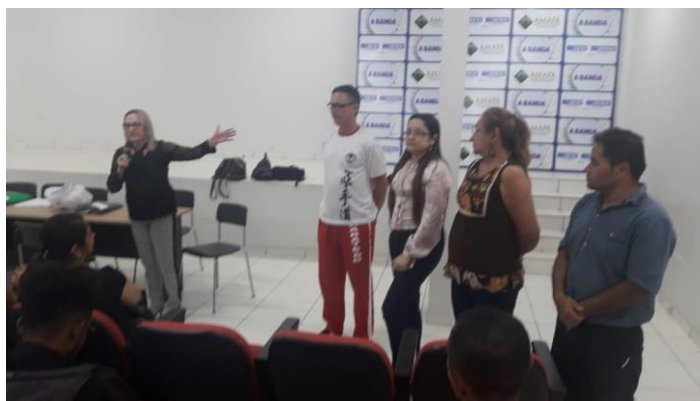
Reunião de ajuste para Eleição unificada