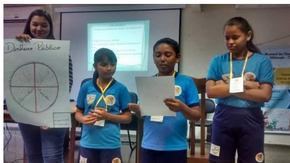
Dinâmica de Acolhimento